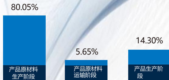
产品各阶段碳排放比例